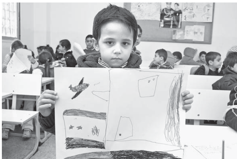
Jako vždy nejvíce trpí děti.